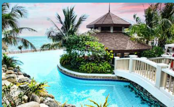
Bearland Paradise Resort