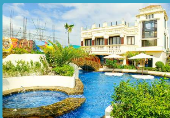
LaSette Resort Hotel